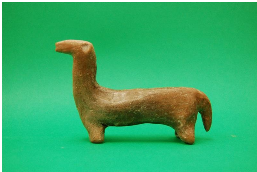
Plastika hlineného konika, staršia železná doba, zo zbierok MMB