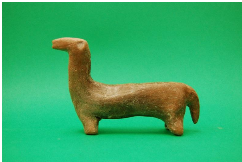
Plastika hlineného koníka, staršia železná doba, zo zbierok MMB