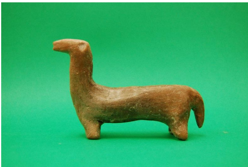
Plastika hlineného konika, staršia železná doba, zo zbierok MMB